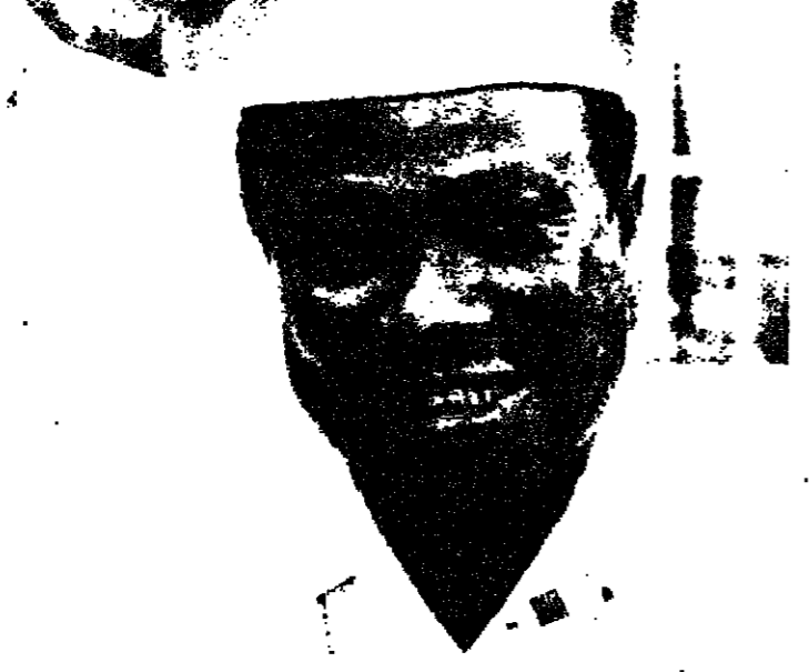
رئيس ليبيا وقيام تولبرت الذي اغتيل امس صورة للابناء من يونانديرس

موروقيا - وقع في موروقيا عاصمة ليبيا فجر امس انقلاب عسكري اطاح بنظام الرئيس الليبي وليام تولبرت - ونشرت وكالات الانباء ان القوات الانقلابية اقتضت في حوالي الساعة الواحدة من فجر امس قصر الرئاسة في موروقيا واشتبكت مع رجال حرس قصر الرئاسة الليبي.